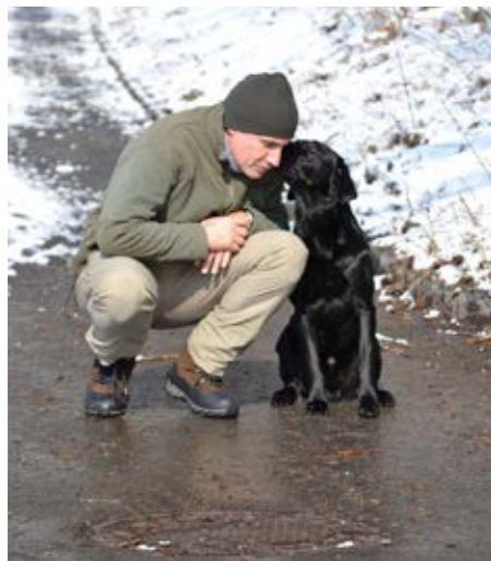
Hunde brauchen ihre Menschen als kompetenten Sozialpartner

Sie sind Rudeltiere und benötigen Sozialpartner, wie Artgenossen oder Menschen. Ohne diese Sozialpartner ist keine artgerechte Hundehaltung gewährleistet. Kettenhaltung ist in Österreich laut § 16 Tierschutzgesetz/Bewegungsfreiheit verboten. Aber auch dauernde Unterbringung in einem Zwinger oder das Isolieren eines Hundes in einem eigenen Raum im Haus ist keine artgerechte Haltung für unseren vierbeinigen Freund. Für eine gesunde Entwicklung braucht ein Hund Familienanschluss!