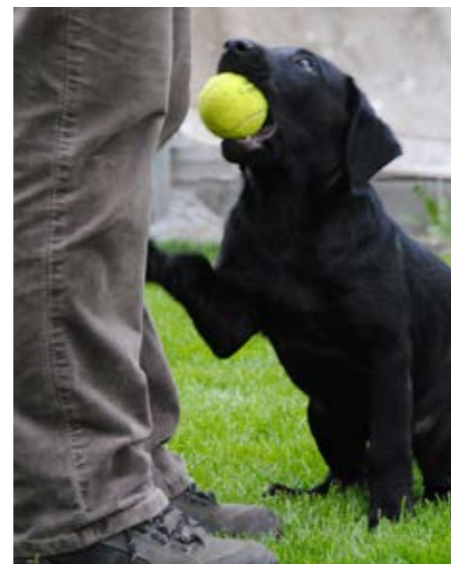
Schon der Welpen lernt von klein auf mit Artgenossen oder Menschen zu kommunizieren